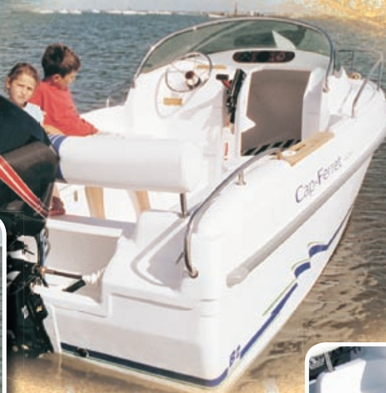
Cockpit autovideur avec deux coffres de rangement sous assises.