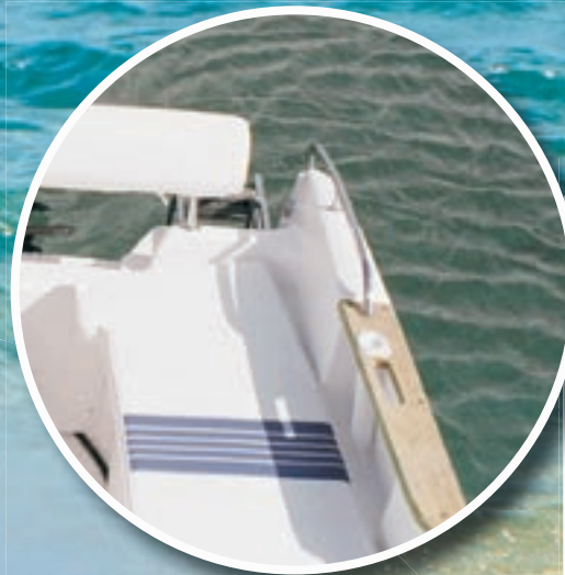
Dossier arrière, sellerie extérieure et main courante arrière sur modèle swing.