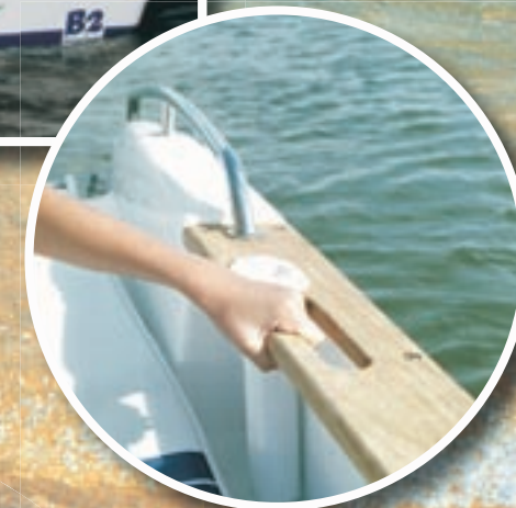
Plat-bord teck avec porte canne.