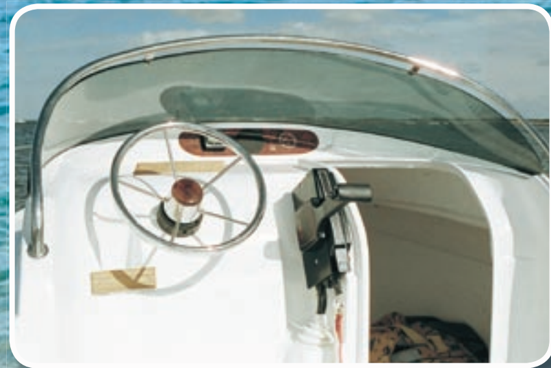
Poste de pilotage ergonomique et main courante de pare-brise inox.