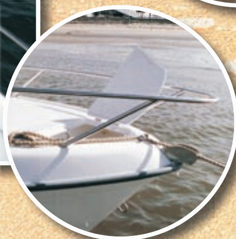
Puits à chaîne autovideur.