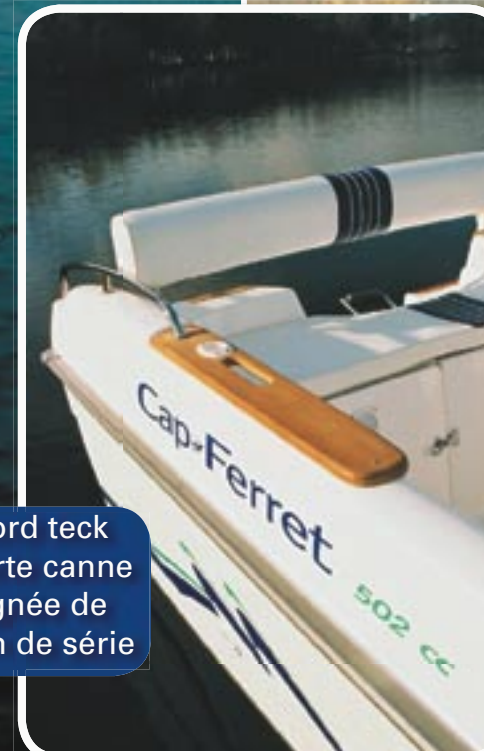
Photo : version swing avec option table de cockpit.

Plat-bord teck avec porte canne et poignée de maintien de série