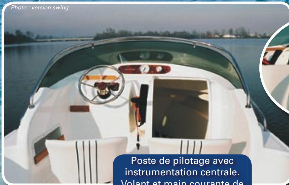
Photo : version swing

Poste de pilotage avec instrumentation centrale. Volant et main courante de pare-brise inox. (Instruments moteur non compris)